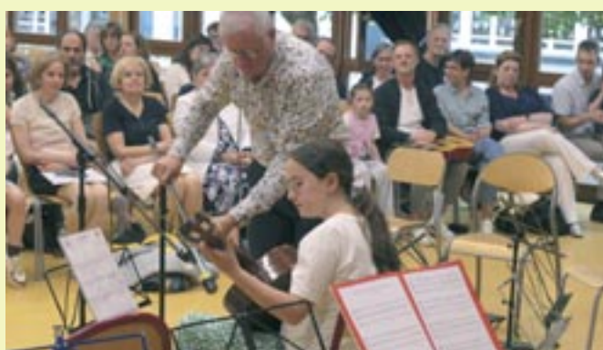
Auditions Ateliers Musicaux de Scy-Chazelles - 21 et 22 mai 2025