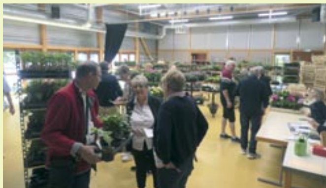
Marché aux fleurs - 10 et 11 mai 2025 - Amitiés Sigéo Castelloses