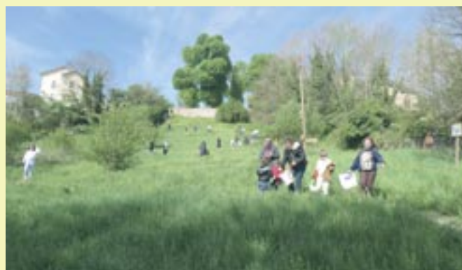
Chasse aux oeufs - 19 avril 2025 - Municipalité