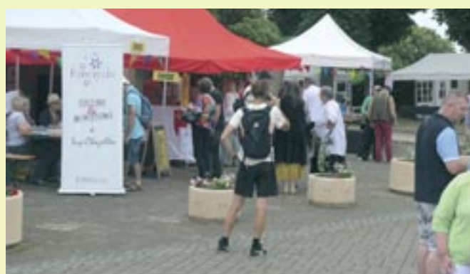
Le Petit Montmartre - 1 er juin 2025 - Etincelles