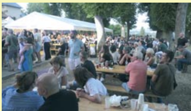
Fête du 14 juillet 2025 - Municipalité et interassociation : Foot, Tennis, Scy-Chazelles Loisirs et LuScyoles