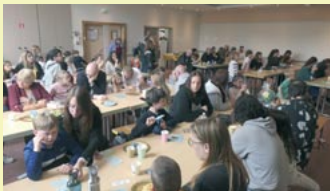
Loto des enfants - 8 juin 2025 - LuScyoles