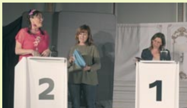
Théâtre La maire veille - 4 avril 2025 - C ie L'île en Joie