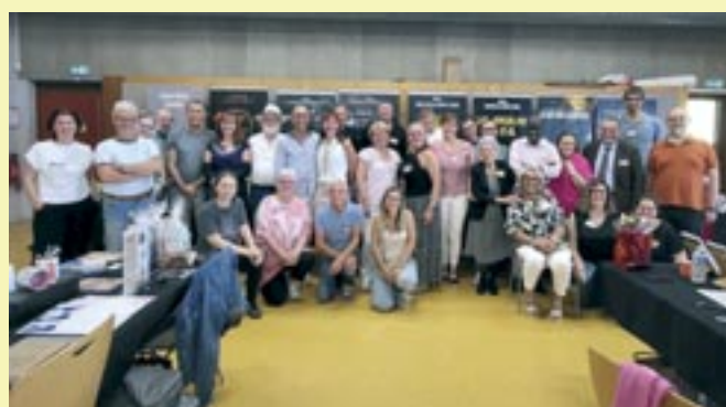
Salon du livre - 6 et 7 septembre 2025 - Etincelles