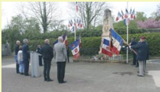
Cérémonie du Souvenir - 12 avril 2025 - Souvenir Français et municipalité