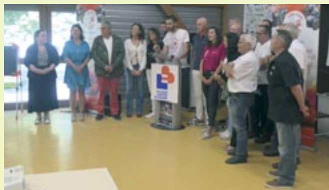
Remise du chèque Une Rose un Espoir - 18 mai 2025