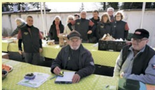
La Quentinoise - 6 avril 2025 - Scy-Chazelles Loisirs