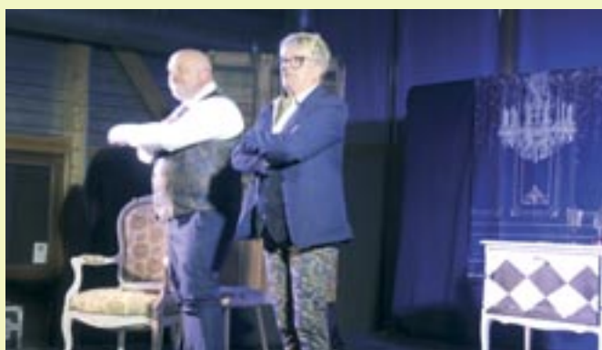
Théâtre Léonie est en vacances - 6 avril 2025 - C ie L'illustre Mascarade