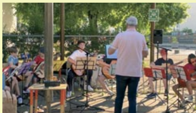
Fête de la Musique - 19 juin 2025 - Ateliers Musicaux de Scy-Chazelles