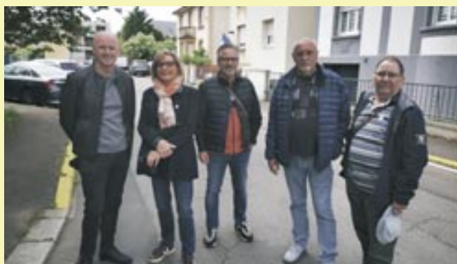
Visites de quartier - 26 avril - 24 mai - 21 juin 2025