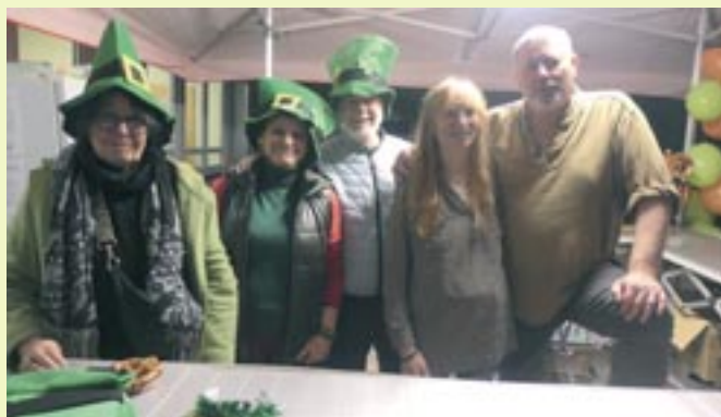
Saint Patrick - 21 mars 2025 - Etincelles