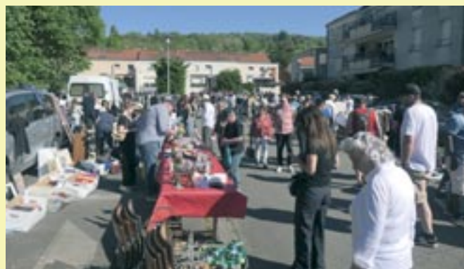
Brocante - 1 er mai 2025 - Scy-Chazelles Loisirs