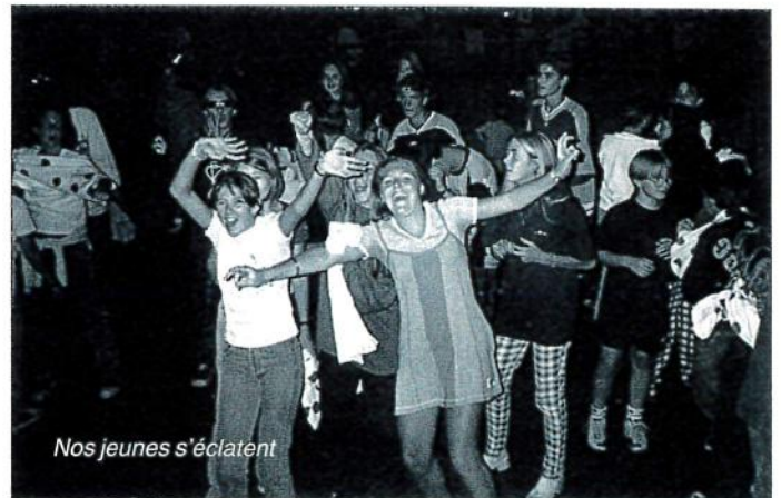
Nos jeunes s'éclatent