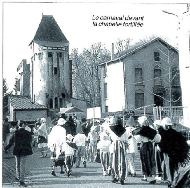
Le carnaval devant la chapelle fortifiée