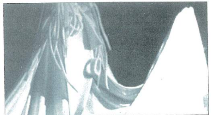
Du rêve et de l'émotion