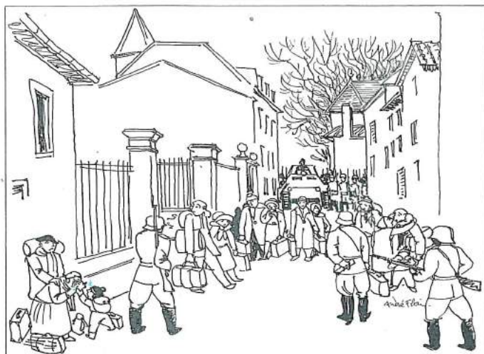
Un douloureux 11 novembre

« J'étais gamin, » se souvient cet habitant du village. « Des bruits couraient que des familles allaient être expulsées. Lesquelles ? Quand ? Où ? Ce jour-là, donc, quelqu'un est venu