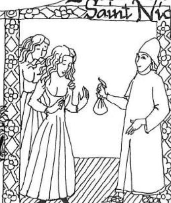
Des filles perdues, à qui il procura un viatique pour les sortir de la prostitution et les inciter à une vie honnête et vertueuse.