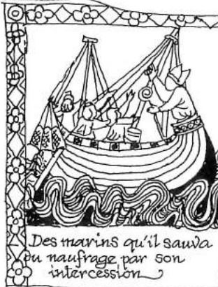
Des marins qu'il sauva du naufrage par son intercession