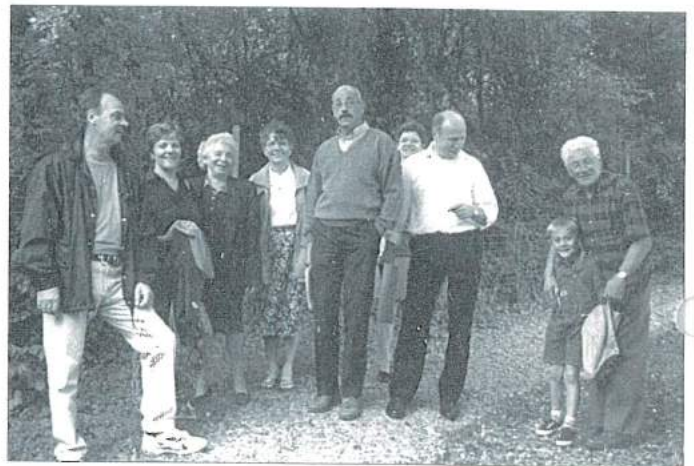
La pause pour la tête et les jambes.

34 personnes, représentant 16 familles, auxquelles s'ajoutaient M. le curé et sœur Marichu, se présentèrent au départ, à la salle de l'amitié, à partir de 13 h 30. Au fur et à mesure des arrivées, quatre groupes furent constitués qui, après avoir examiné leur questionnaire et établi leur itinéraire, s'élancèrent pour l'aventure.