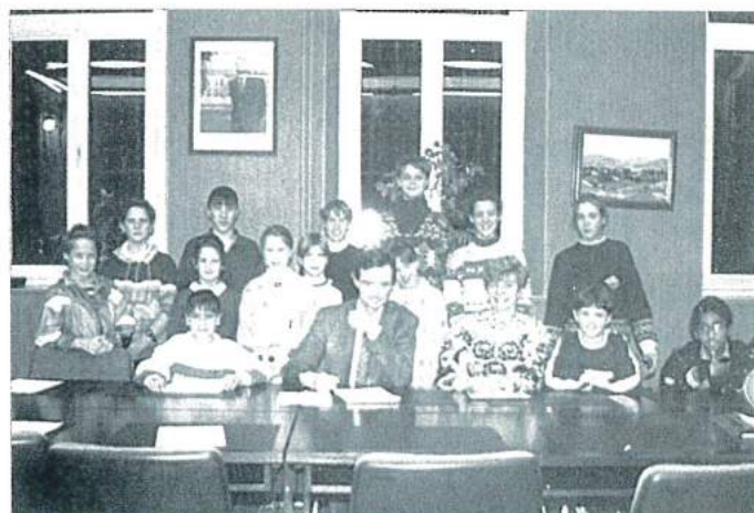
Les jeunes Conseillers Municipaux de Scy-Chazelles.