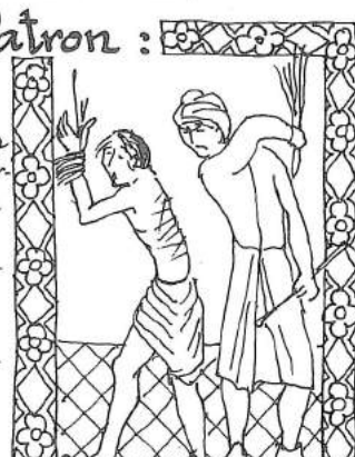
Des innocents injustement châtiés, qu'il a libérés par ses prières.

Et surtout, il est le Patron des Écoliers et des petits Enfants, grâce à sa légende, rapportée par Saint Bonaventure et magnifiée par la Tradition populaire: "Ils étaient trois petits enfants, qui s'en allaient..."