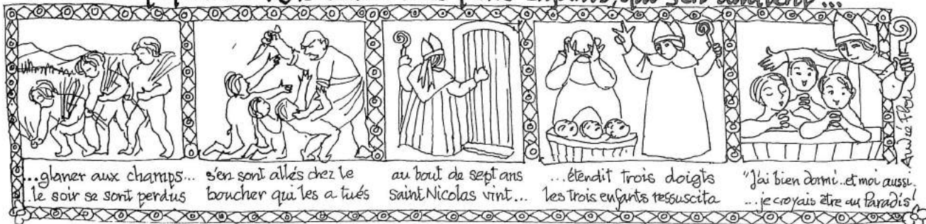
...glaner aux champs... le soir se sont perdus

Et surtout, il est le Patron des Écoliers et des petits Enfants, grâce à sa légende, rapportée par Saint Bonaventure et magnifiée par la Tradition populaire: "Ils étaient trois petits enfants, qui s'en allaient..."