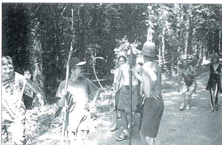
Une rude expédition pour nos ados : vivement le goûter !

Parfois, des parents ou des membres du conseil municipal nous rendaient une petite visite imprévue pour prendre la température du camp. Le soir, tradition oblige, nous organisons un feu de camp. Chant,