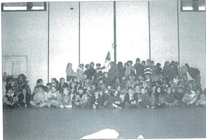
Une visite toujours tant attendue !

Fidèle à la tradition, Saint-Nicolas, bravant le froid et les premiers flocons, est venu le 5 décembre rendre visite aux écoliers de Scy-Chazelles.